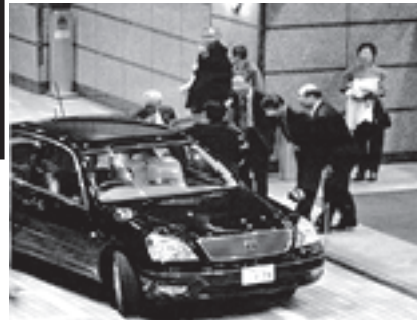
政治資金パーティー ●政治資金パーティー 平成18年2月23日、多摩センター駅前ホテルにおいて都議の新春の集いが開かれました。しかしこの「新春の集い」は政治家個人の政治活動、政治資金パーティーです。