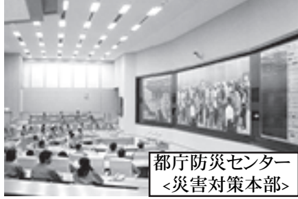
都庁防災センター <災害対策本部>

●執務室へは階段で!! 18時30分までに居酒屋に入れば、宴会の帰りに酔っぱらって「知事が執務する7階でも、都民の個人情報がつまっています。執務室のある各階へも」階段・エレベーターを使い自由に行くことができないのです。しかし、行革110番の指摘で警備が強化されましたが、まだ心配です。