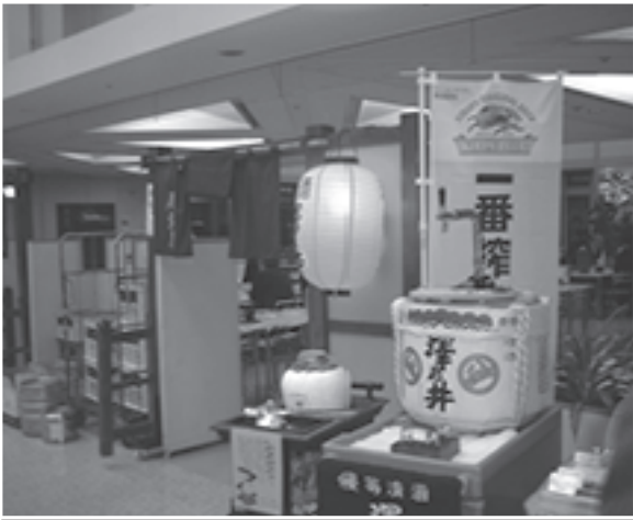
↑ 32階食堂は午後5時30分から居酒屋に変身する

●遅れたお客さんには!! 確かに18時30分から部外者は入れません。しかし宴会に遅れてきたらどうするの? と聞くと担当者が1階受付玄関までむかえにくくといふのです。行革110番が注意したところ、迎えに行くことはダメになりました。