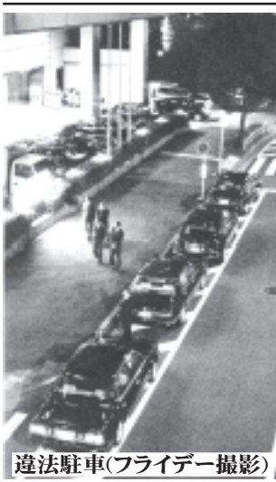
違法駐車

行革110番は、当日13台の都庁公用車を確認しました。その公用車は左写真のようにホテルの駐車スペースに入りきらず、ホテル前の駐車禁止場所に列をなして停めています。警察はなぜ取り締まらないのでしょうか。