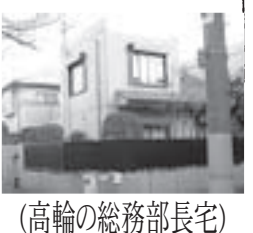
(高輪の総務部長宅)