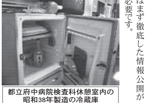
都立府中病院検査科休憩室内の昭和38年製造の冷蔵庫