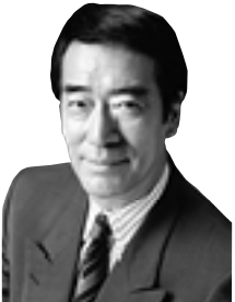
参議院議員 中村敦夫

参議院選挙を比例全国区で闘うことを宣言した環境政党「みどりの会議」の政官中村敦夫代表委員は、政治家の税金のムダ遣いについて、「私は、議員連盟・公共事業チェック委員の会の会長をしていますが、これまで視察や調査をしたほとんどの事業が、国民に借金を押し付けているだけ、何の役にもたないものばかりです。一般会計予算は80兆円強ですが、税金は40兆円そこそこです。政治家も官僚も現在の税金も将来の税金(借金)も、使えるものは使っちゃまえない態度です。本当に必要なものだけを予算計上したら、おそらく20兆円くらいのムダが出てくるかも知れません。」と語ってくれた。