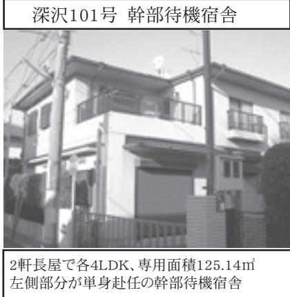
深沢101号 幹部待機宿舎